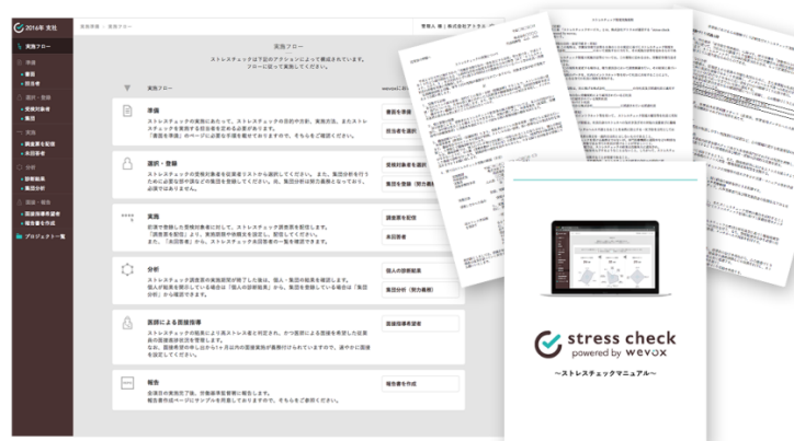
実施フロー、実施マニュアルを用意しております

wevox とは、会社への「愛着心」や「思い入れ」などのエンゲージメントや組織の現状を、本サービス上で用意している独自のサーベイを用いて定量的かつ多角的に把握し、それを基に組織を改善していくためのサービスになります。wevox は「エンゲージメント機能(β版)」と「ストレスチェック機能」の2つよりサービスが構成されております。