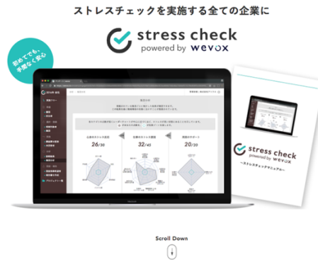
サービス紹介ページ

株式会社アトラエ（本社：東京都港区 代表取締役：新居 佳英 以下、アトラエ）は、社員の声から組織としての課題を可視化させることで組織を改善することを可能とする新サービス「wevox（ウィボックス）」のストレスチェック機能である「stress check powered by wevox」( https://wevox.io/stress_check/product/ )を正式リリース致しました。